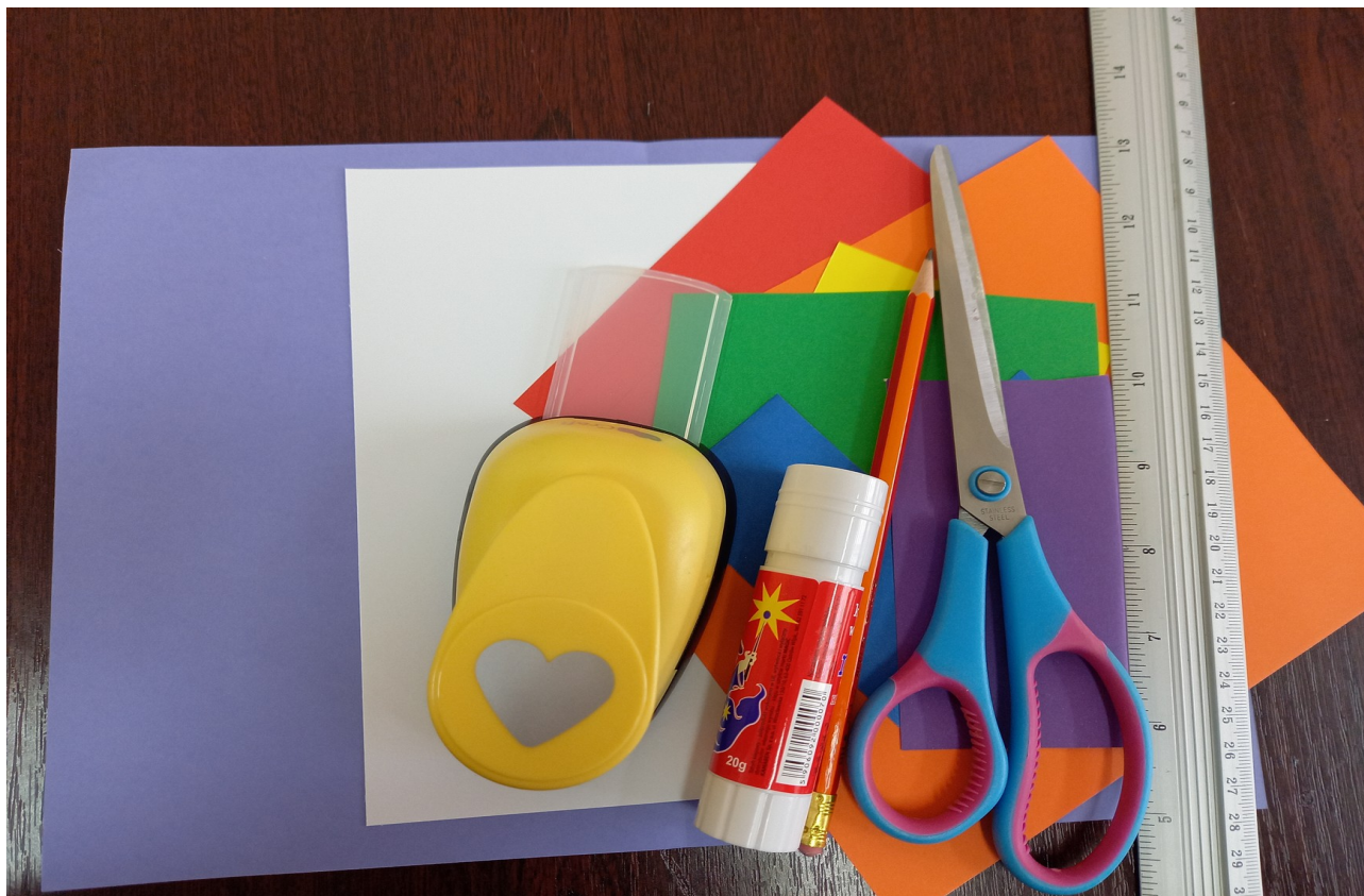
Krok 1. Złóż kartkę na pół.

Będą nam potrzebne materiały: papier formatu A 4 (kratka), biała kartka, ścinki papieru w kolorach tęczy, dziurkacz ozdobny w kształcie małego serca, nożyczki, klej, linijka i ołówek.